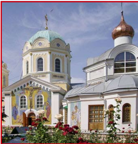
Catedrala Sfânta Treime din Simferopol

Biserica Ortodoxă din Ucraina a hotărât canonizarea Sfântului Ierarh Luca, arhiepiscopul Crimeei în noiembrie 1995, iar la 17 martie 1996 moaștele sale au fost deshumate, fiind mutate cu mare alai la 20 martie 1996 în Catedrala Sfânta Treime din Simferopol. Puțin mai târziu, la 25 mai 1996, și Sinodul Bisericii Ortodoxe Ruse îi recunoaște sfințenia.